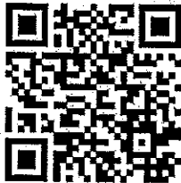
Official Facebook Event

Official Email: icomos.ahmt.2016@gmail.com