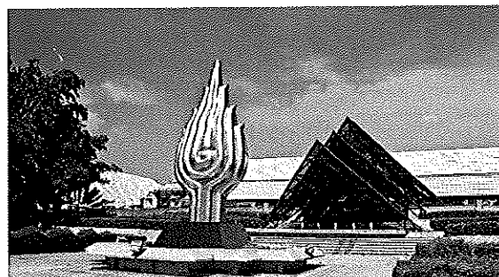
Venue: Queen Sirikit National Convention Center (QSNCC), Bangkok, Thailand